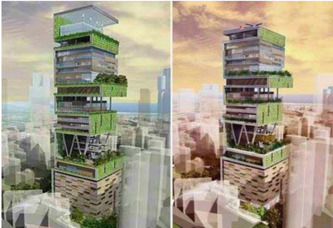
Mumbai - Rendering delle Antilla Building, un progetto di "Eco-friendly green building"