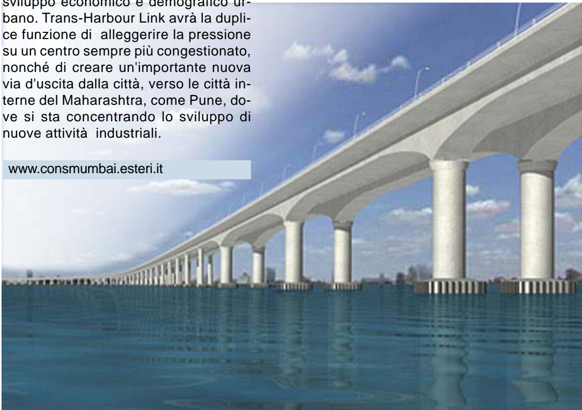
Il progetto per il Mumbai Trans Harbour Link