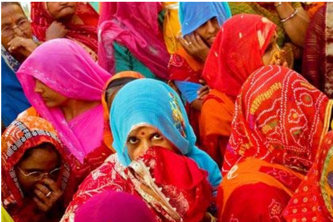
Rajasthan - Spose

È senz'altro così. L'Italia è oggi il quarto partner commerciale europeo dell'India. Tuttavia, alla fine del decennio appena trascorso, a dispetto del lusinghiero incremento messo a segno dalle vendite dei nostri prodotti sul mercato indiano (+30% nel solo 2010), l'interscambio faceva registrare un surplus, seppur ancora moderato, a favore dell'India, ed i saggi dei rispettivi prodotti nei panieri delle importazioni si equivalevano, con una contrazione della percentuale italiana a circa l'1% rispetto al picco storico del 3% registrato alla fine degli anni 70. Il Made in Italy non ha potuto infatti beneficiare, al pari dei prodotti degli altri Paesi, di un forte radicamento produttivo su questi mercati. Nel 2010 erano circa 400 le imprese italiane in India, delle quali poco più di 100 presenze produttive. Nel 1998 tali presenze erano 60. Un incremento senza dubbio non irrilevante, ma limitato rispetto a quelli registrati dalle presenze industriali delle aziende americane, tedesche, o francesi, tanto più ove si consideri il valo- ➤