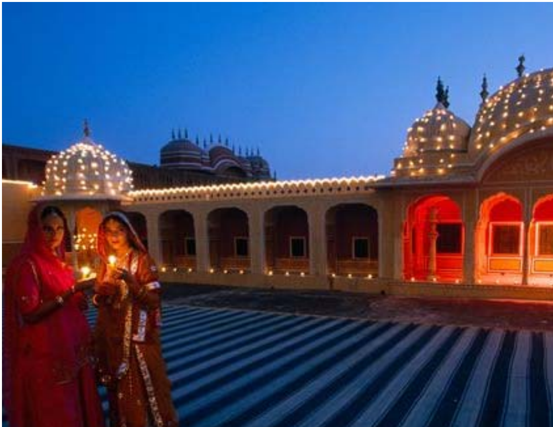
Jaipur - Il Festival delle Luci

La Missione di Sistema ci ha del resto insegnato molto. L'interazione con la dirigenza indiana ha permesso alla delegazione in visita di mettere meglio a fuoco la "posta in gioco" e la necessità di un "cambio di approccio" quale condizione per affermarsi su questi mercati. È emersa una fortissima domanda indiana per un approfondimento della collaborazione nei settori tessile e conciario e nel campo del design industriale. Sarà opportuno tener presenti tali indicazioni nel prosieguo della nostra azione promozionale. Occorrerà poi racciocinare sempre meglio la nostra azione alle caratteristiche di questo grande mercato: formare consorzi con operatori locali per aggirare i limiti che hanno fino ad oggi frenato la partecipazione delle aziende italiane al florido mercato delle commesse pubbliche indiane; essere disponibili a realizzare alleanze industriali in vista di una indigenizzazione dei prodotti che potrebbe comportarne, in un primo tempo, costi di produzione elevati ed una riduzione degli standard di qualità. »