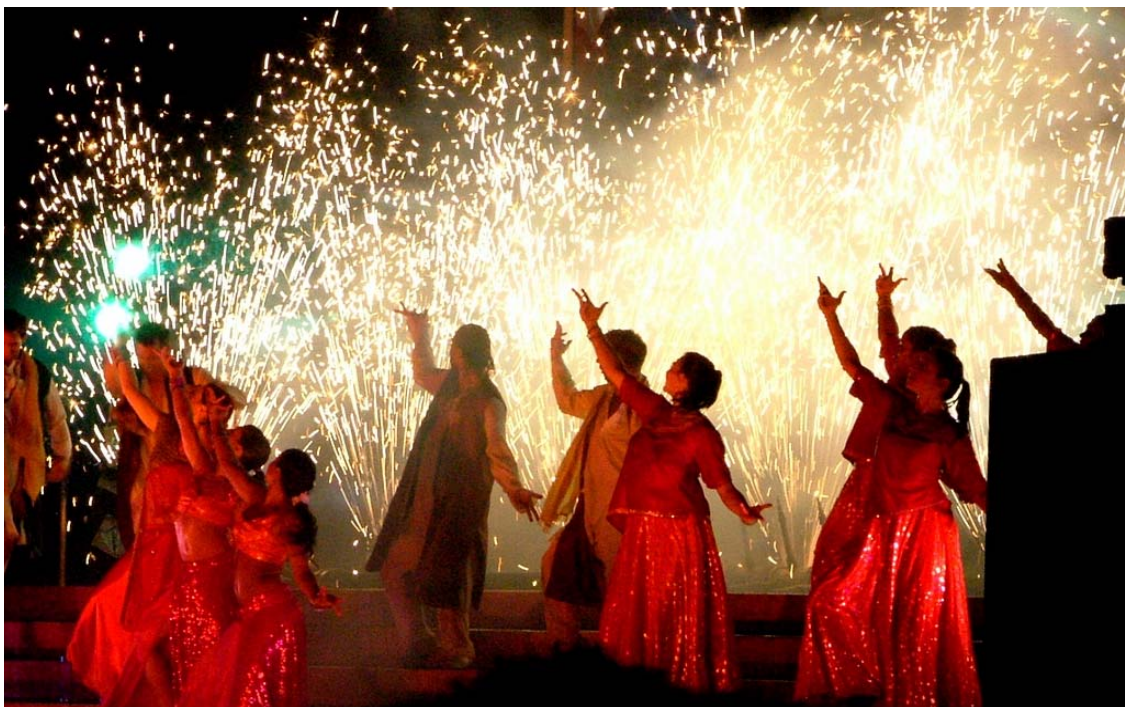
Bollywood - La scena di un film

ma in cui buona parte dell'intermediazione finanziaria (circa l'85% degli asset aggregati del settore) fa capo alle banche. Anche perché la maggior parte delle imprese, soprattutto quelle medie e piccole, hanno difficoltà ad accedere a canali alternativi di finanziamenti (bond, mercato azionario ecc). Da rilevare che RBI riveste sia la funzione di Banca Centrale, sia quella di supervisione dell'intero sistema. Che peraltro appare molto solido sotto il profilo della capitalizzazione degli Istituti di credito, della limitata esposizione verso strutture "opache", e della contenuta incidenza delle sofferenze creditizie. RBI si appresta comunque a introdurre nuovi metodi di controllo del rischio a presidio del sistema e già oggi sottopone periodicamente gli Istituti a stress test di verifica delle rispettive esposizioni di mercato. Infine nel corso dell'incontro è stata dedicata una "finestra" anche ai nuovi canali di finanziamento delle imprese con interventi dei presidenti della Indian Private Equity and Venture Capital Association e dell' Indian Angel Network . Settori che si stanno sviluppando sul mercato anche se, al momento, operano su dimensioni relativamente contenute (10 miliardi di dollari annui il valore delle operazioni realizzate nel 2011). ■