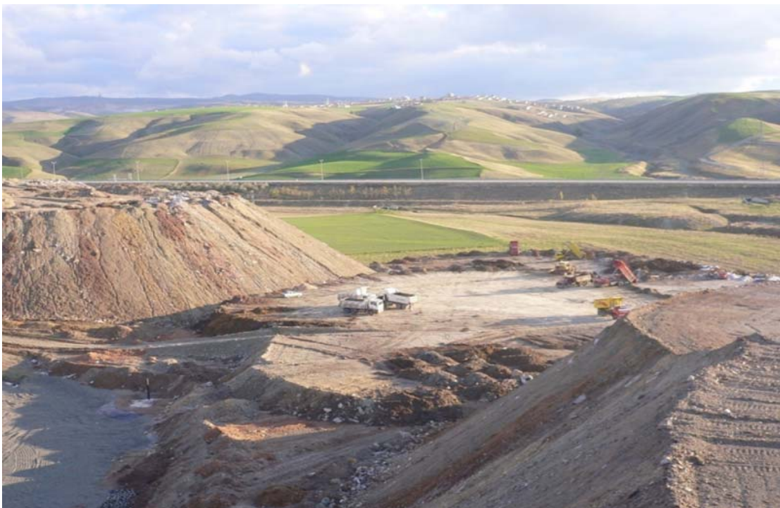
Una discarica nei pressi di Ankara

to all'Europa, sottolineato anche da Erol Kaya , presidente della Commissione per l'Ambiente . Il deficit riguarda sia la raccolta differenziata che lo smaltimento in discarica ed è imputabile principalmente a carenze nelle operazioni di raccolta e stoccaggio da parte delle singole Municipalità. Donmez ha poi fornito alcuni dati sull'utilizzo dei rifiuti per la produzione di energia che in Turchia risulta nettamente inferiore rispetto alla media dei Paesi europei. I rifiuti sottoposti alla cosiddetta termovalorizzazione ammontano infatti solo a 143 mila tonnellate. Coprono quindi appena il 2,3 per mille del totale, rispetto ad una media dei Paesi ►►