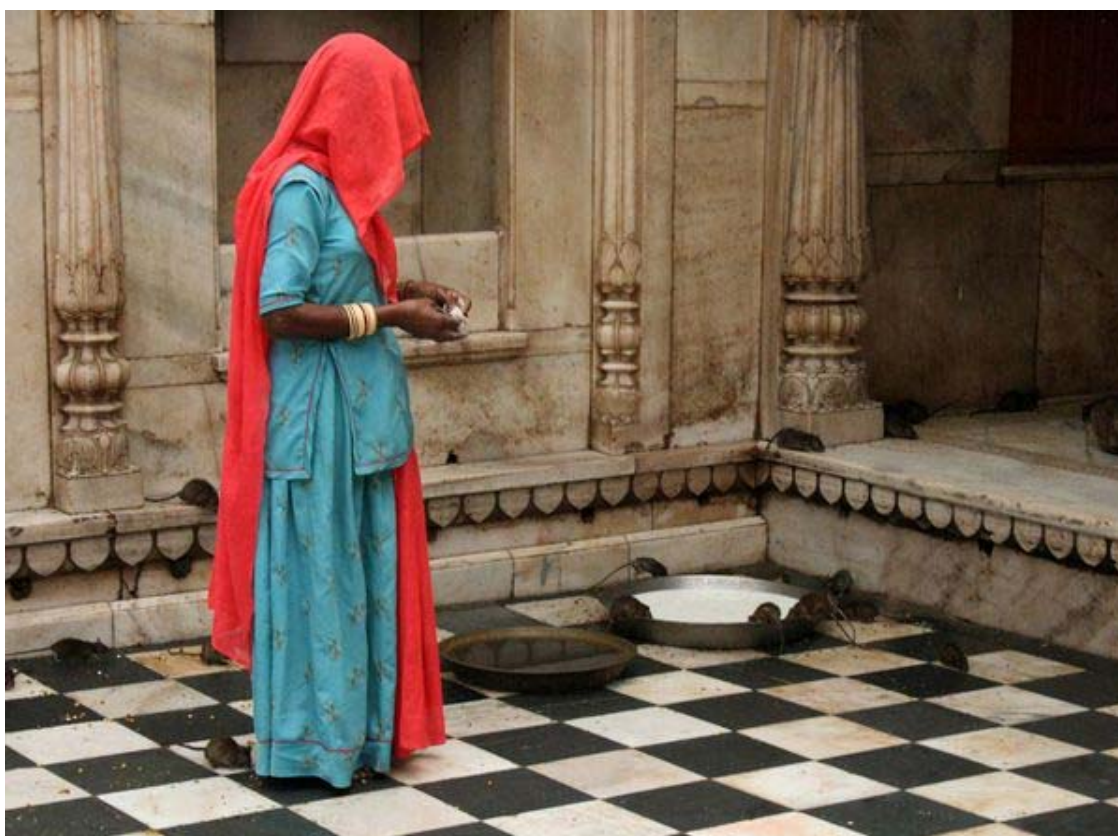
Deshnoke - Il Tempio dei Topi