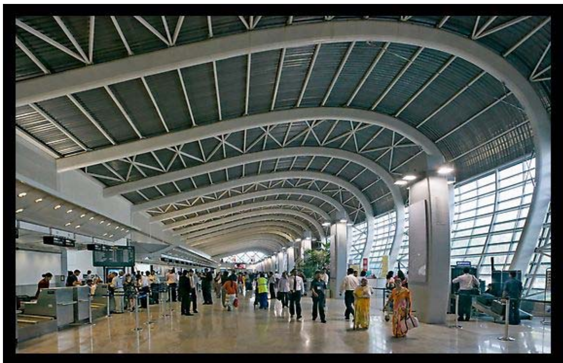
Mumbai - L'aeroporto

di lavoro creati dall'industria dei servizi e dall'IT sono stati in larga misura assorbiti dalla minoranza qualificata della forza lavoro, mentre la maggioranza dei lavoratori "unskilled" ne è rimasta esclusa. Gli sforzi del Governo indiano si focalizzano oggi sull'imperativo di correggere il percorso di sviluppo del Paese, per renderlo più "inclusivo" e sostenibile. La nuova Politica Nazionale Manifatturiera, adottata proprio a ridosso della Missione di Sistema, rappresenta la car- ▶