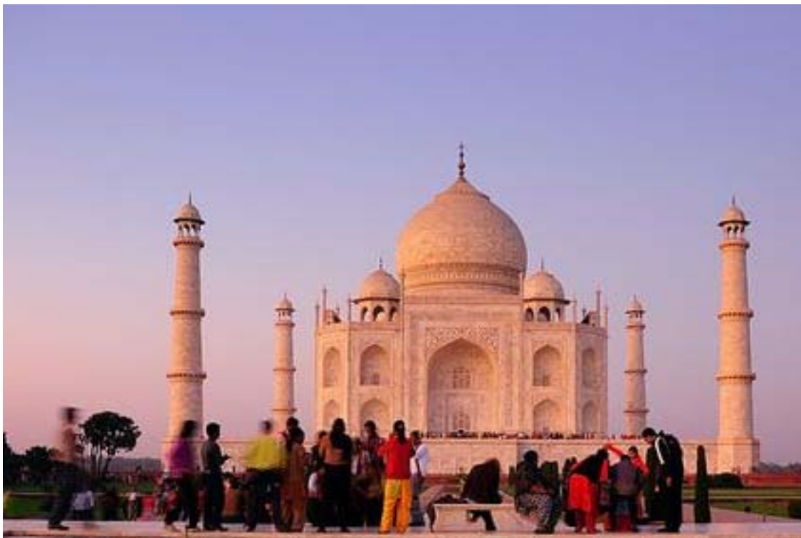
Agra - Il Taj Mahal

me potenzialità: la tradizione democratica del Paese dà all'India un obiettivo vantaggio rispetto alla Cina, ma nel breve periodo meccanismi decisionali collegiali, su molteplici livelli di governo, rendono più complesso il percorso delle riforme ed un pesante apparato burocratico fa spesso attrito alla loro messa in opera; una popolazione immensa e giovanissima è senz'altro uno dei fattori centrali dell'equazione di potenza del Subcontinente, ma perché il "dividendo demografico" indiano sprigionerà il suo potenziale occorrerà dar risposta ad una enorme domanda inevasa di sanità ed istruzione. Ciò che posso dire, ad oltre un anno dall'assunzione del mio incarico, è che questo è un Paese che ha un senso profondo della propria grandezza, un'immensa fiducia nel proprio futuro nonché - direi anche - la pazienza necessaria per raggiungere tutti i traguardi fissati. Sentimenti, questi, che accomunano i ceti dirigenti ed una classe media sempre più ampia e dinamica, ma che sono condivisi anche dalle fasce della popolazione meno abbienti, animate da una forte volontà di contribuire alla grandezza del Paese. Le oceaniche manifestazioni in India a favore del "buon governo" e contro la corruzione della ▶▶