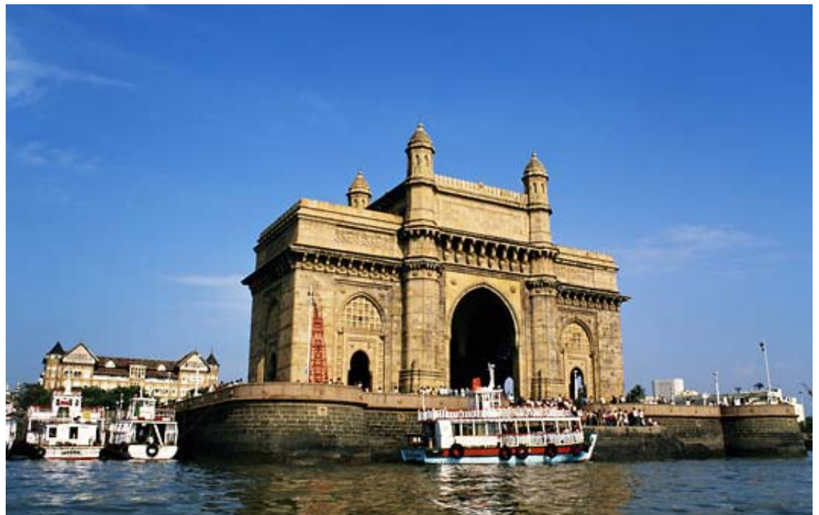
Mumbai - The Gateway of India