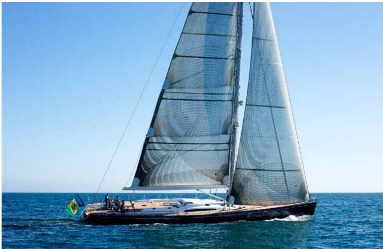
Uno yacht costruito dal cantiere Southern Wind

Leggi gli aggiornamenti su www.notiziariofarnesina.ilsole24ore.com