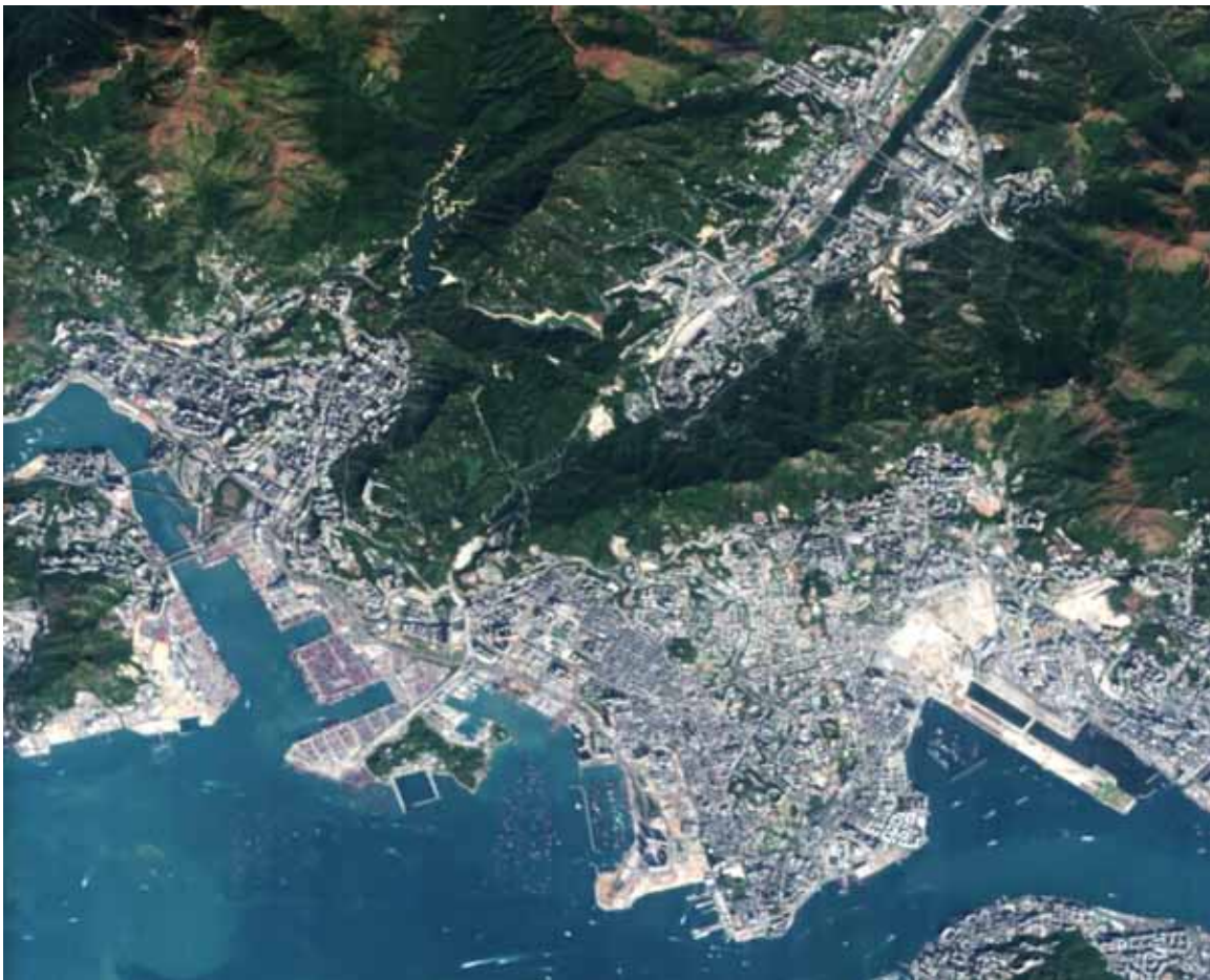
Il porto di Hong Kong visto dal satellite