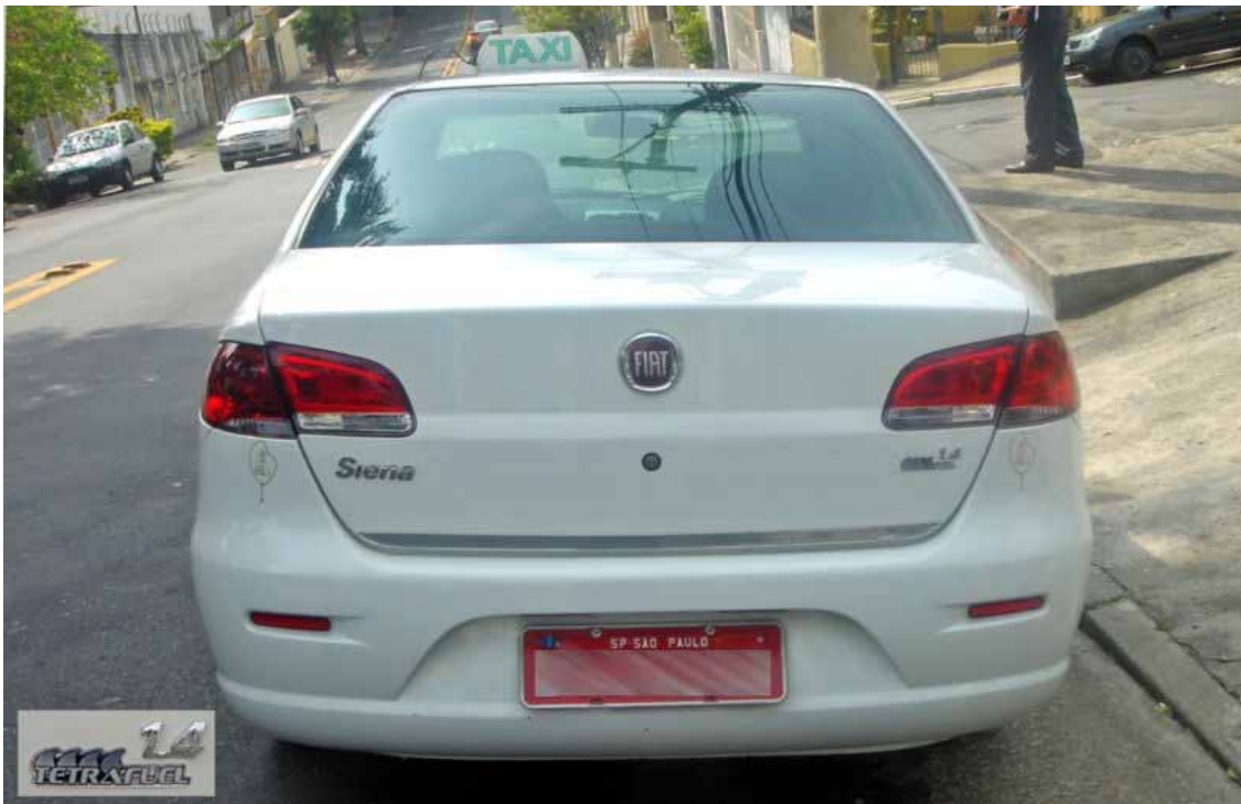
Siena Tetraflex. Vista posteriore dell'auto, scattata a Sao Paulo, Brasile. In evidenza la targhetta che la identifica come un veicolo multicarburante. Essa può infatti utilizzare indifferentemente benzina, etanolo brasiliano (E20-E25), etanolo puro (E-100), qualunque miscela dei suddetti carburanti e alternarvi automaticamente il gas naturale (CNG)