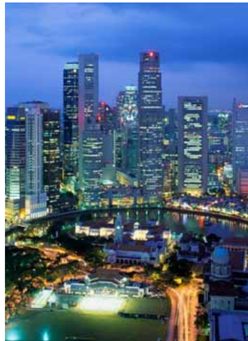
Kuala Lumpur, lo skyline della città