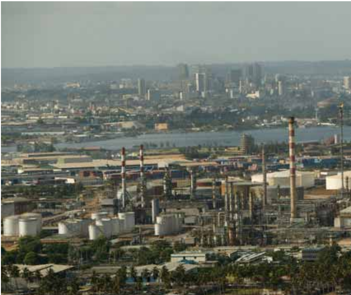
Abidjan, la zona industriale

Attualmente il capitale dell'Aeroporto di Lubiana è detenuto per circa il 51 per cento dallo Stato, per il 14 per cento dai due fondi pensionistici pubblici SOD e KAD, per un altro 6 per cento da società a maggioranza a capitale pubblico e per il restante 29 per cento da azionisti privati. ▶