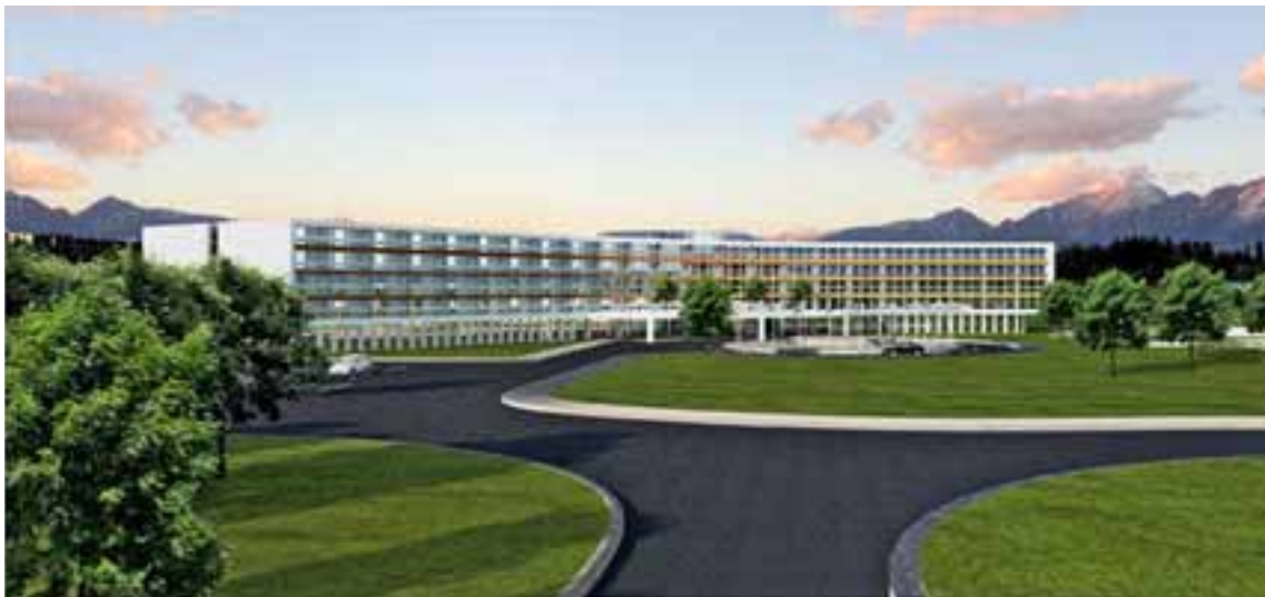
Lubiana, un rendering del nuovo terminal di Aeropolis

Il Ministro del Commercio e Industria Miguel Sebastián ha convocato in Madrid un vertice con i rappresentanti delle imprese del settore energetico, di infrastrutture, fabbricanti di automobili e Amministrazioni territoriali al fine di definire un programma integrato di lancio dell'auto elettrica che sarà presentato nel primo semestre 2010, durante la presidenza spagnola del Consiglio UE. A Madrid, Barcellona e Siviglia è stato avviato un programma per dotare a medio termine le città di 550 punti di ricarica per auto elettriche e varare incentivi per favorirne il suo uso. A Madrid le auto elettriche non pagheranno il parcheggio nelle zone di stazionamento regolato. ▶