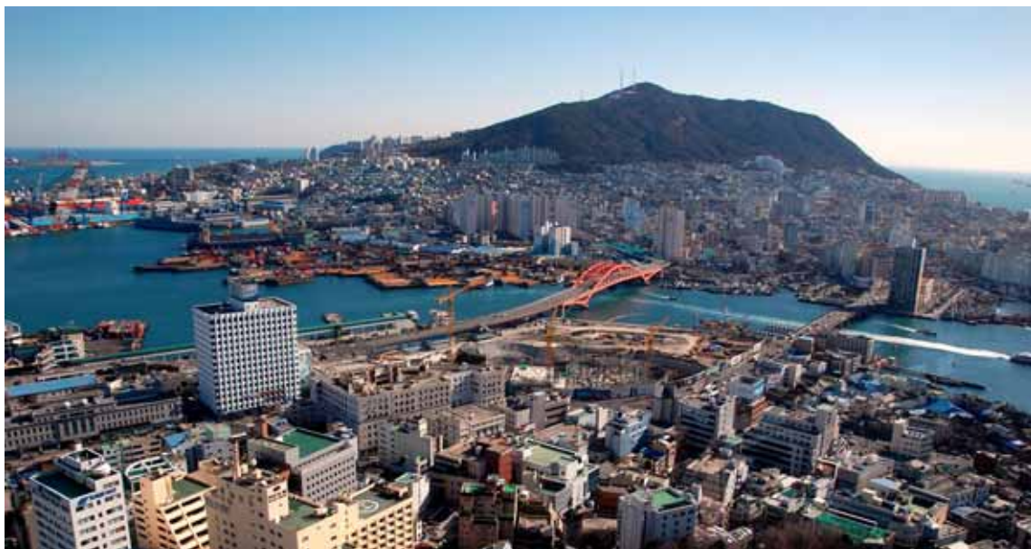
Busan (Corea), il porto e l'isola di Geoje