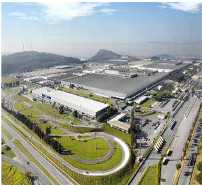
Betim (Brasile), lo stabilimento Fiat