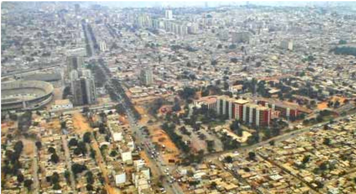
Luanda, veduta aerea della città