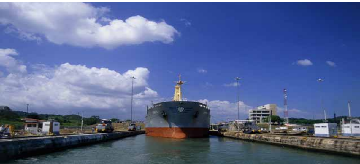
Panama; il Canale