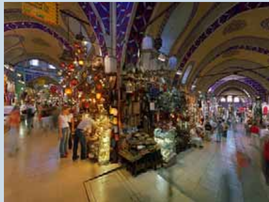
Istanbul, il Grand Bazar