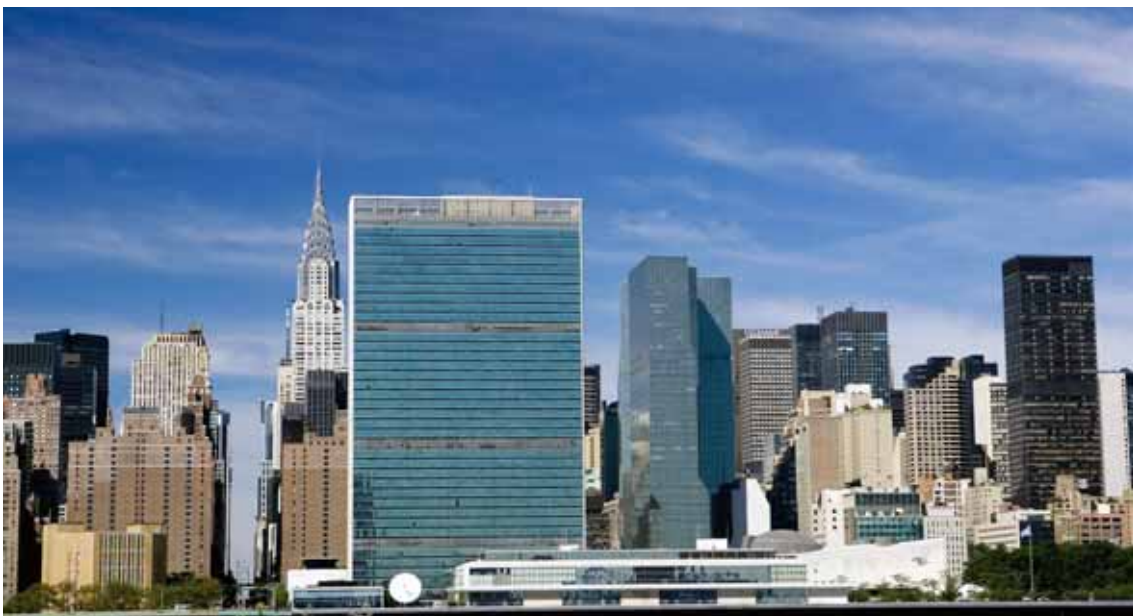
New York, la sede dell'Onu