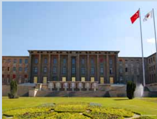
Ankara, la sede del Parlamento turco

Il Presidente del KIK ha precisato che la rimozione varrà solo ed esclusivamente a beneficio delle imprese di origine europea. La Turchia però si riserva di decidere, sulla base delle regole vigenti nell'Organizzazione Mondiale del