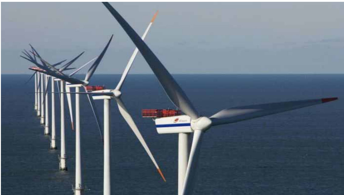
Un parco eolico offshore