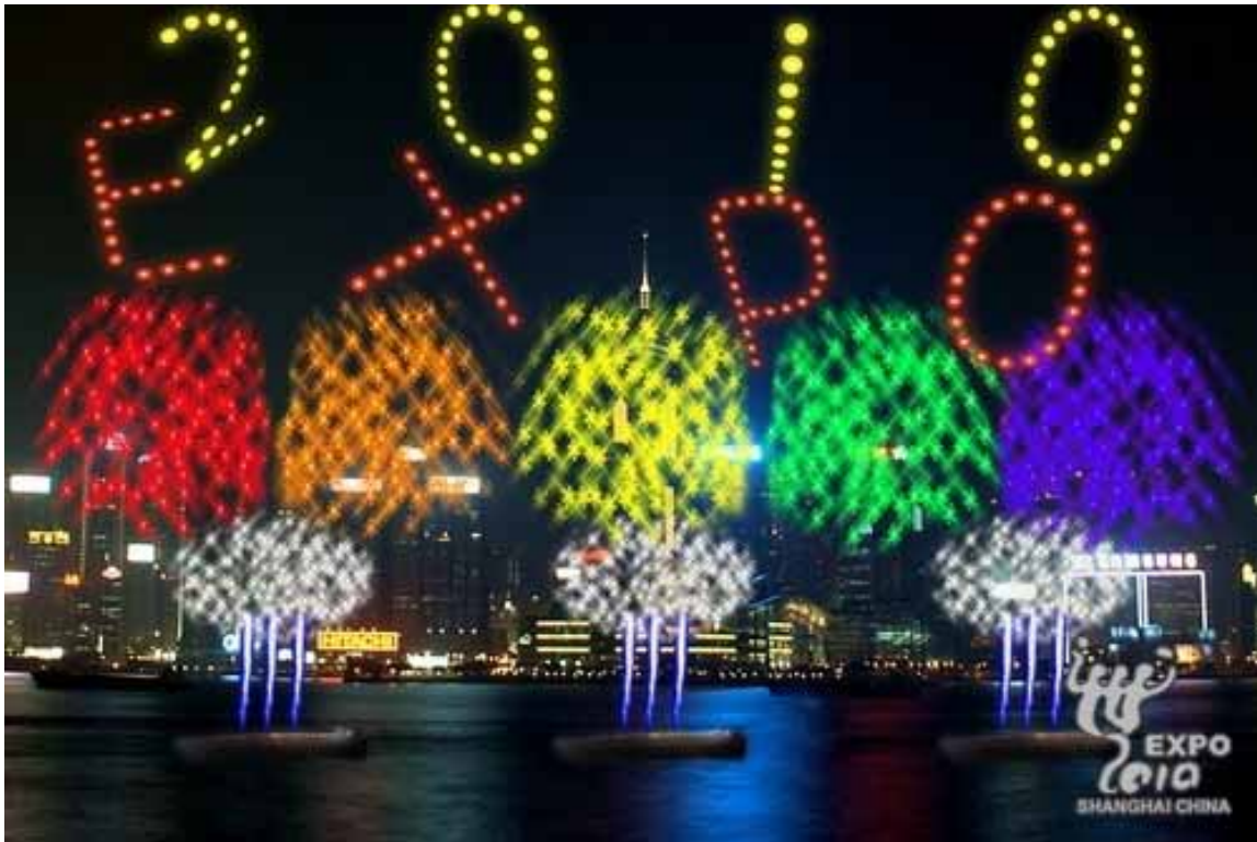
Hong Kong, la sera del 15 febbraio il cielo ha brillato per 23-minuti con i fuochi artificiali allestiti in onore dell'imminente World Expo di Shanghai