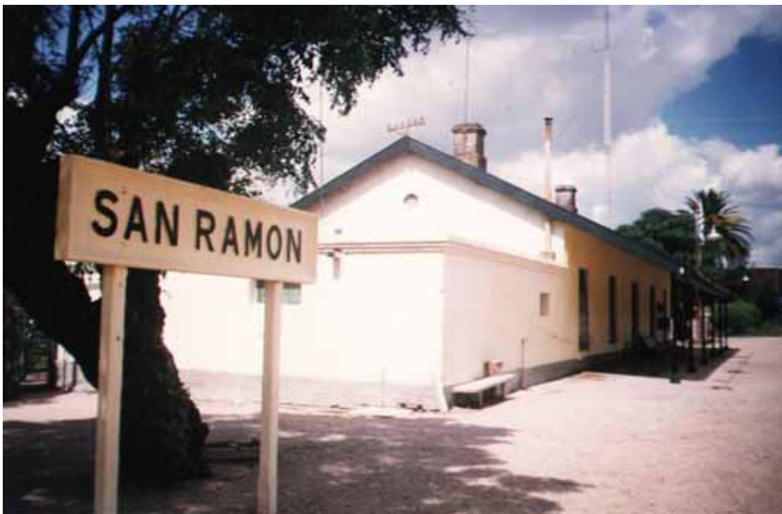
San Ramon. La stazione ferroviaria del centro situato a 80 Km da Montevideo

Per ora sono disponibili i fondi per la riparazione della tratta Montevideo-Rivera (420 km), capoluogo di uno dei Dipartimenti settentrionali confinanti con il Brasile. I lavori inizieranno nei prossimi mesi. Si stanno pianificando anche interventi di recupero delle tratte Tacuarembò-Fray Bentos (379 km) per un costo stimato in 160 milioni di dollari e Treinta y Tres-Rocha nonché di altre diramazioni, principalmente a scopo di trasporto merci. Mujica ha già avuto colloqui preliminari con il Presidente del BID (Banca Interamericana di Sviluppo) Alberto Moreno , per ottenere un supporto finanziario. ▶