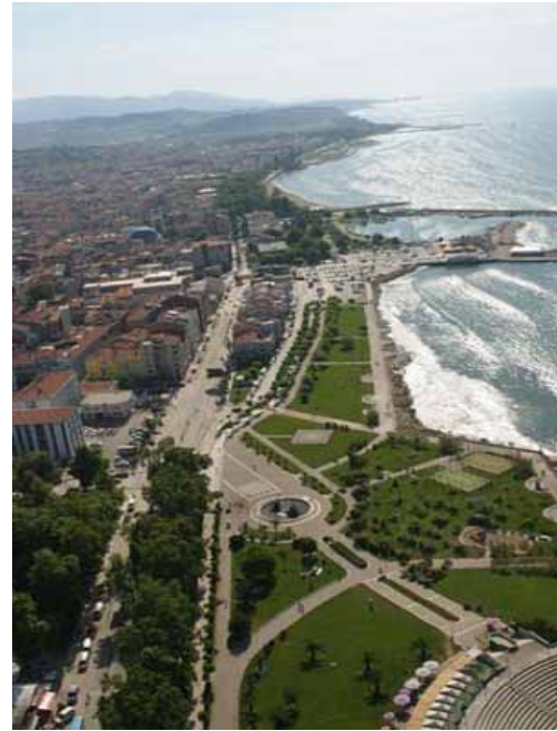
Turchia, la costa nei pressi di Yalova