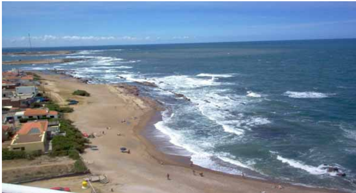
La Paloma (Rochas, Uruguay), una spiaggia