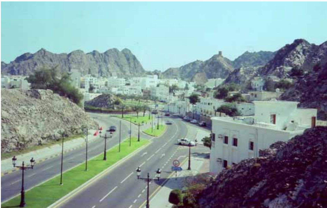
Mascate (Oman), l'ingresso della città