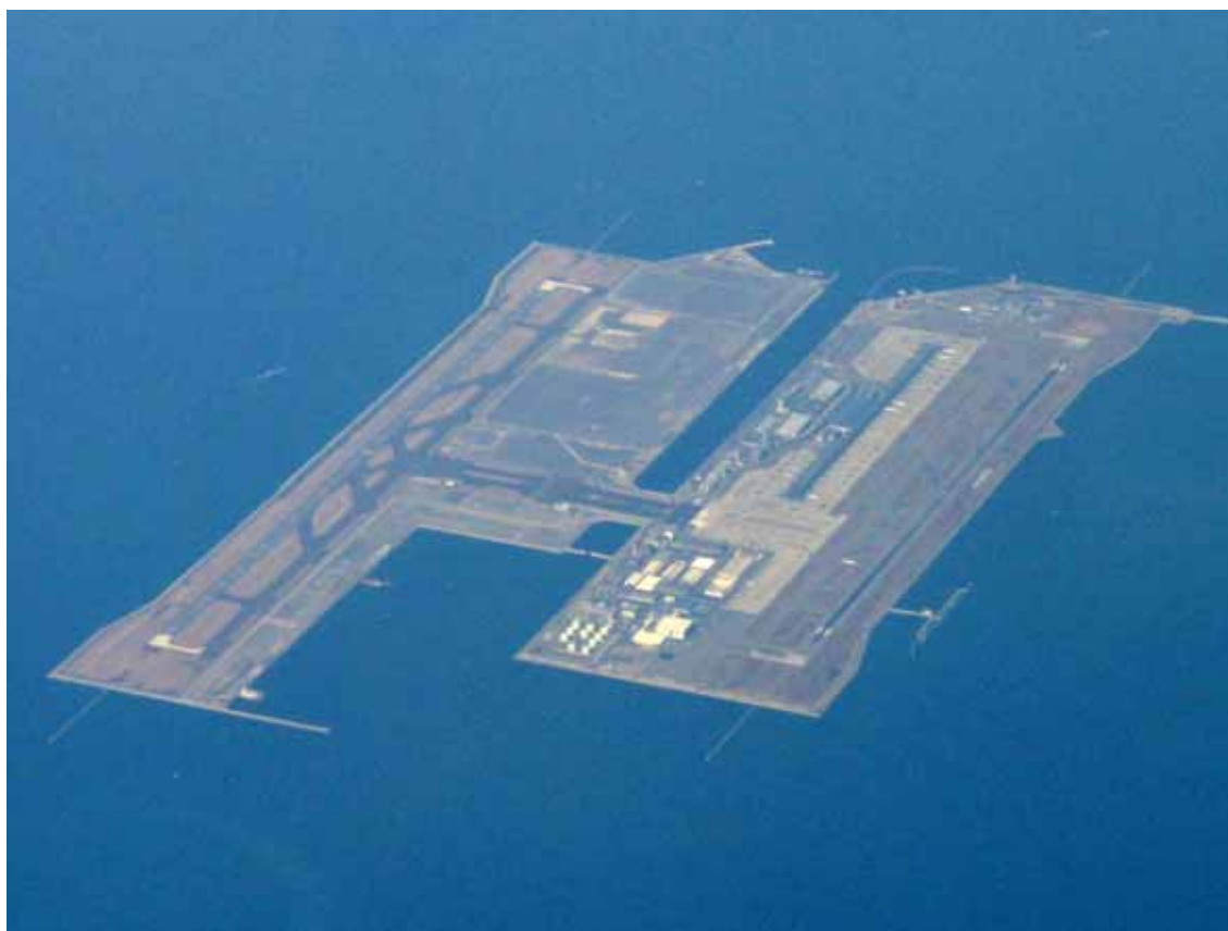
Osaka, l'aeroporto internazionale Kansai è ospitato su un'isola artificiale situata al centro della Baia