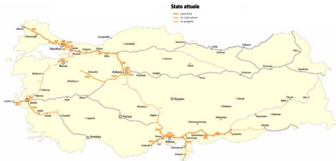
La mappa delle autostrade turche

(Elaborazione grafica di Maximilian Dörrbecker per Wikimedia)