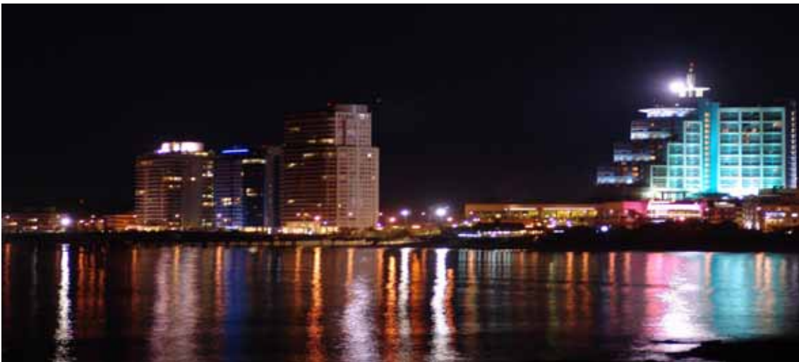
Punta del Este. Veduta notturna di uno dei principali centri turistici dell'Uruguay

È sempre difficile parlare di modelli perché, nella realtà, nessun Paese e nessun Sistema è uguale ad un altro. Ma ritengo che Mujica stia guardando con interesse a esperienze come quelle di Singapore per quanto riguarda le attività logistiche e lo sviluppo della cosiddetta economia della conoscenza. L'Uruguay del resto, ha un' eccellente tradizione universitaria sia pubblica che privata , che in parte ha subito un processo di decadimento e ►►