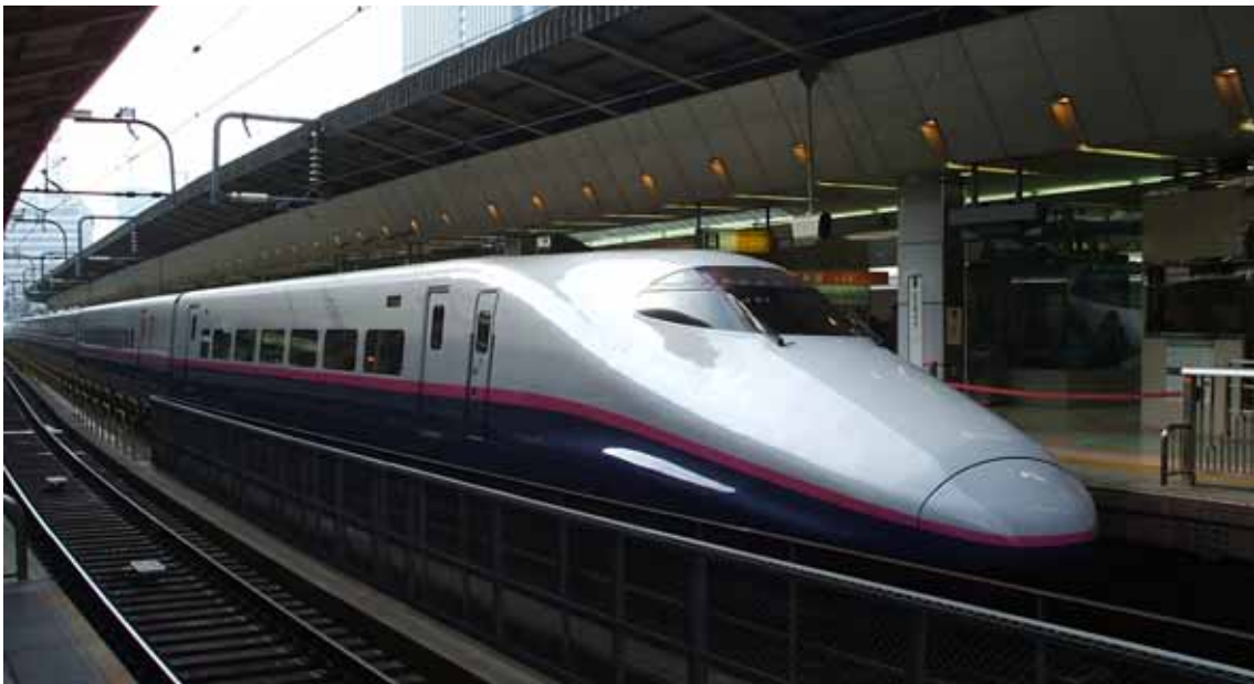
Osaka, il treno ad alta velocità (Shinkansen) alla stazione di Shin-Osaka

Interventi urbanistici importanti sono previsti anche nell'area del porto. ▶▶