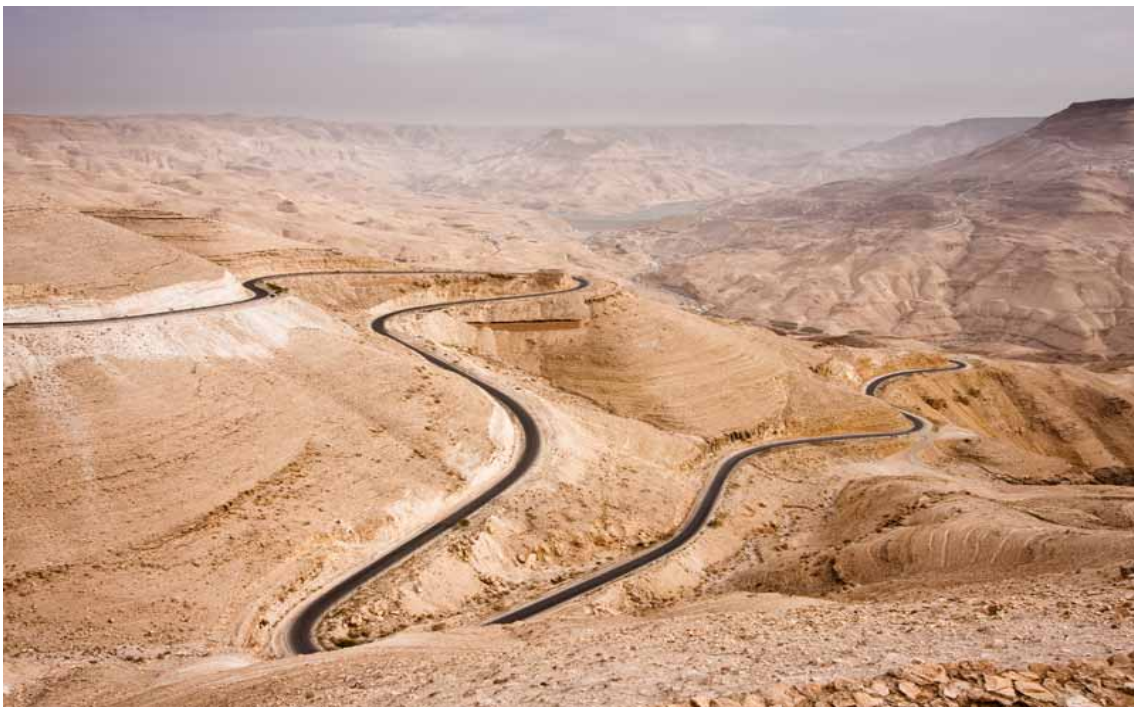
Giordania, argille petrolifere nel deserto