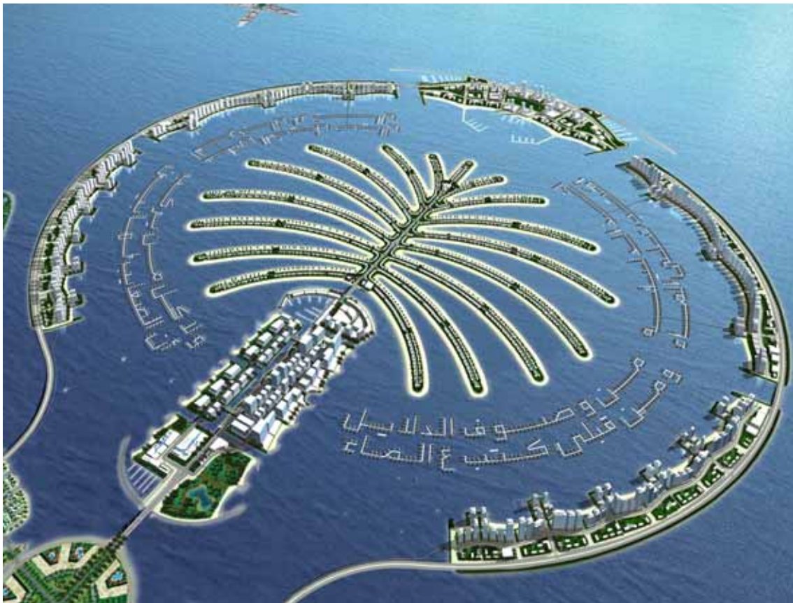
Abu Dhabi , l'isola artificiale di Jebel Ali, per cui Impregilo ha realizzato un impianto di dissalazione