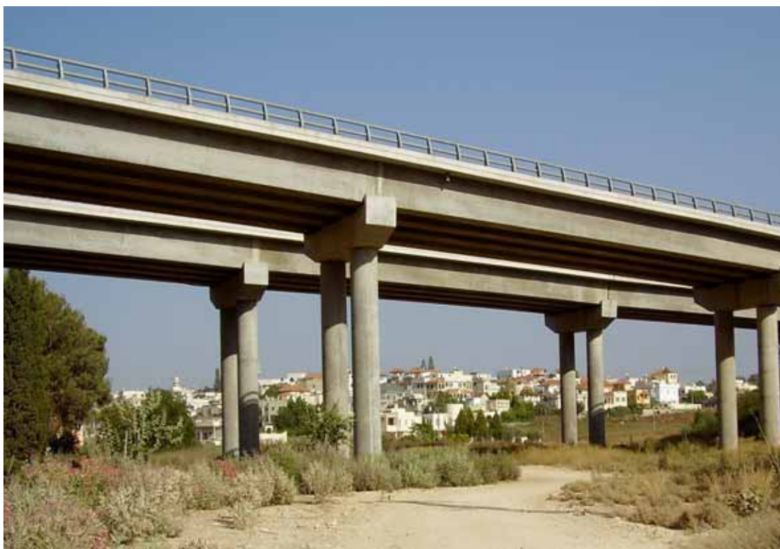
Israele, il viadotto della Trans-Israel Highway sul Narbeta wadi. Sullo sfondo, il villaggio arabo-israeliano di Meiser