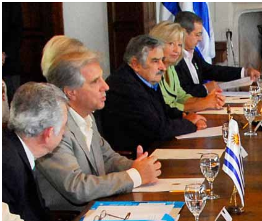
Il gabinetto ministeriale del presidente Vázquez (secondo da sinistra), di cui fa parte José Mujica (terzo da sinistra).